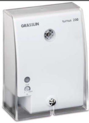
CÔNG TẮC QUANG ĐIỆN TURNUS 200