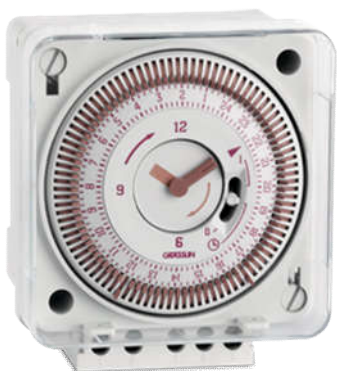
CÔNG TÁC ĐỊNH THỜI GIAN TACTIC 211.1