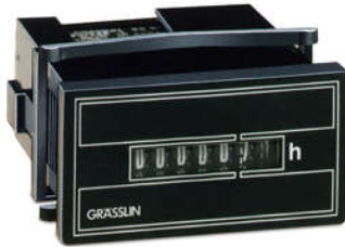
ĐỒNG HỒ ĐẾM GIỜ TAXXO 712 (FWZ 55 K) Kiểu Module