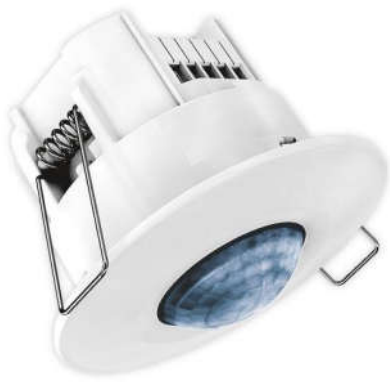
CẢM BIẾN HIỆN ĐIỆN TALIS PF 360-8-1 Âm trần