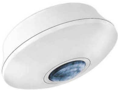
CẢM BIẾN HIỆN ĐIỆN TALIS PS 360-7-1 Trần nổi