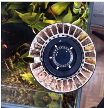
THIẾT BỊ CHO CÁ ĂN TỰ ĐỘNG RNDOMATIC 400