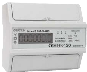
ĐỒNG HỒ ĐO ĐIỆN NĂNG TAXXO E 100-3-MID 3 Pha, dạng Digital, gắn trên thanh DIN