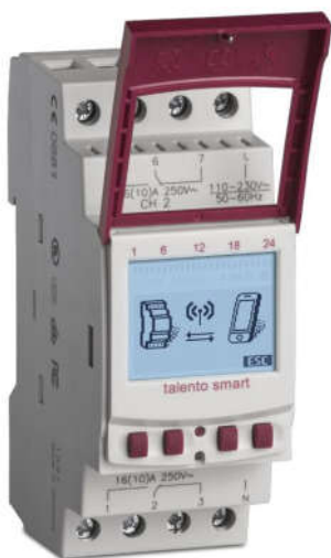
CÔNG TẮC ĐỊNH THỜI GIAN TALENTO SMART B15 Loại điện tử Có Pin, gắn trên thanh DIN