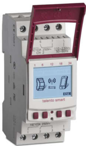
CÔNG TẮC ĐỊNH THỜI GIAN TALENTO SMART C25 Loại điện tử Có Pin, gắn trên thanh DIN