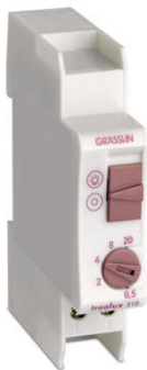
CÔNG TẮC ĐIỀU KHIỂN ĐÈN CẦU THANG TREALUX 210