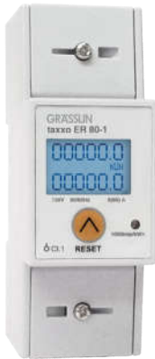
ĐỒNG HỒ ĐO ĐIỆN NĂNG TAXXO ER 80-1 1 Pha, dạng Digital, gắn trên thanh DIN