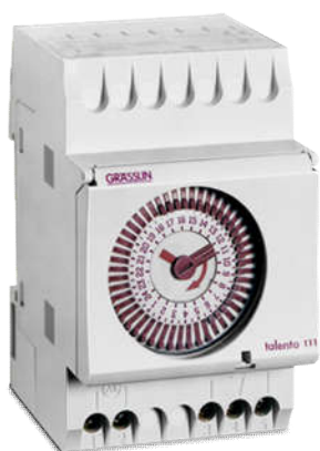
CÔNG TÁC ĐỊNH THỜI GIAN TALENTO 121 Loại cơ Có Pin, gắn trên thanh DIN