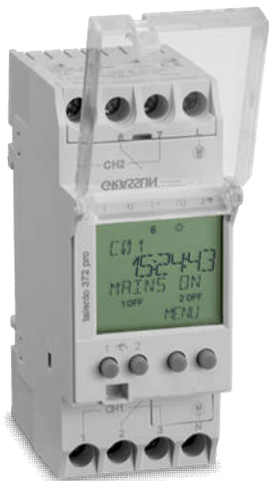
CÔNG TÁC ĐỊNH THỜI GIAN TALENTO 372 PRO Loại điện tử Có Pin, gắn trên thanh DIN