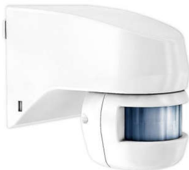
CẢM BIẾN CHUYỂN ĐỘNG TALIS MW 180-12-1 Ốp tường