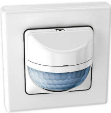
CẢM BIẾN CHUYỂN ĐỘNG TALIS MWF3 200-9-1 Âm Tường