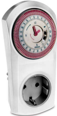
Ổ CẮM ĐIỆN HẸN GIỜ TOPICA 400S Loại cơ, dạng phích cắm