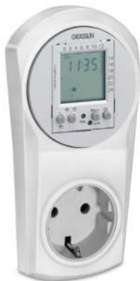
Ổ CẮM ĐIỆN HẸN GIỜ TOPICA 600 Loại điện tử, dạng phích cắm