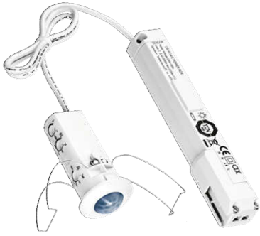
CẢM BIẾN CHUYỂN ĐỘNG TALIS MFM 360-6-1 Âm trần