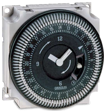
CÔNG TÁC ĐỊNH THỜI GIAN FM/1 QRTUZH Loại cơ Có Pin, dạng Module